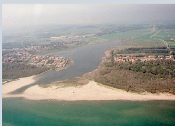
Una suggestiva immagine aerea dell'Oasi del Simeto

«Il Simeto con la sua forza e imponenza - si legge in una nota diffusa dagli organizzatori - oltre ad aver trasportato tonnellate di materiale alluvionale dorato come le spiagge del litorale della Plaia che nel tempo ha contribuito a creare, ha trasportato enormi tronchi grande