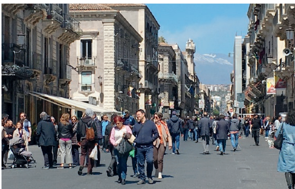
Shopping prenatalizio in via Etnea. I commercianti del centro storico lamentano un sensibile calo delle vendite anche nel periodo delle festività